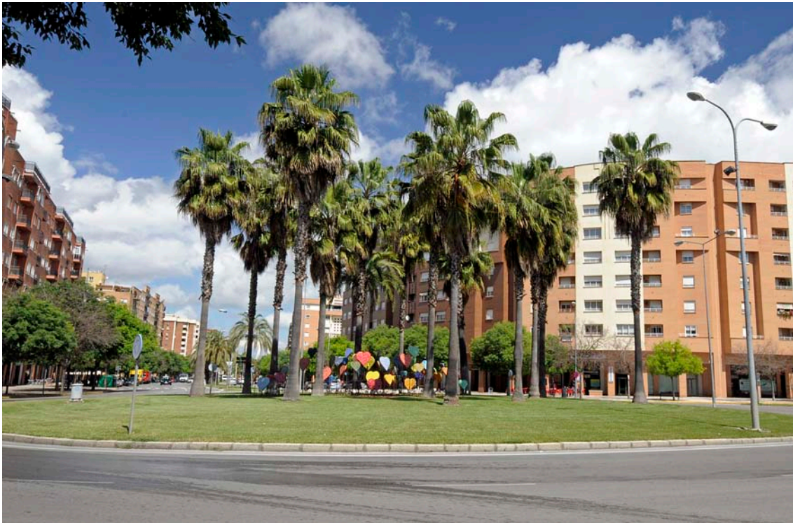
Vista de la glorieta Víctimas del Terrorismo en la Avenida Sinfiriano Madroñero de la ciudad de Badajoz. La glorieta contaba ya con una docena de palmeras que sombrean parcialmente el monumento.

El Ayuntamiento de Badajoz en la zona de ensanche de la ciudad había nombrado una glorieta a la memoria de las Víctimas de Terrorismo y prometió un homenaje a todas las víctimas del terrorismo extremeñas. "Queremos un monumento que no pase desapercibido, que todo el mundo lo vea, lo reconozca y recuerde la deuda que la sociedad tiene con las víctimas", dijeron. Honestamente, también hicieron mención a la difícil situación económica de los ayuntamientos en tiempos de crisis.