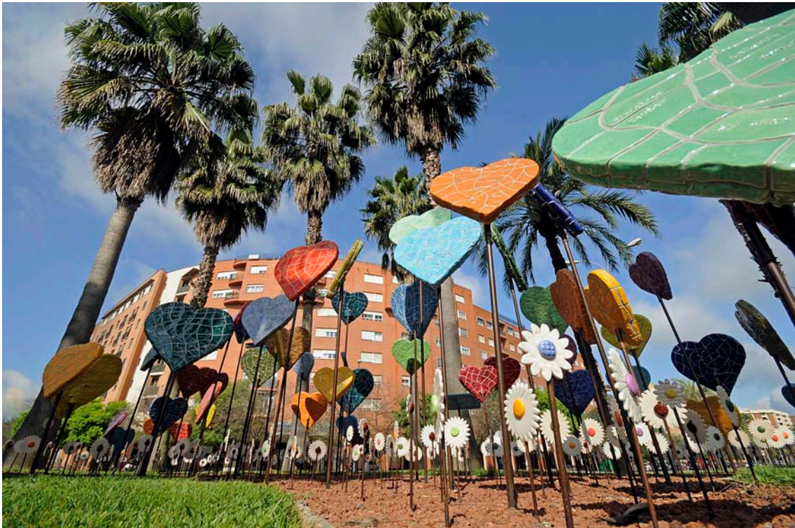
Monumento homenaje a las Víctimas del Terrorismo de Badajoz, una propuesta de diseño artesano.