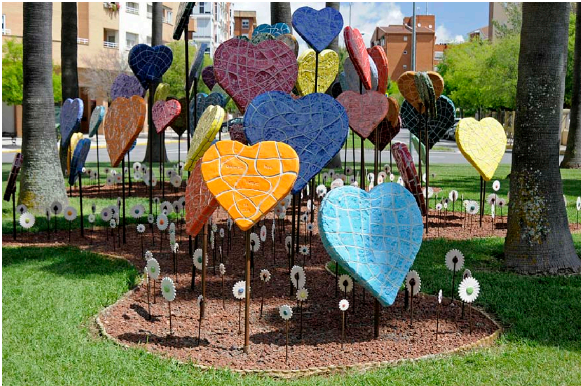
Vista del monumento Homenaje a las Víctimas del Terrorismo de Badajoz en su contexto y sus circunstancias.